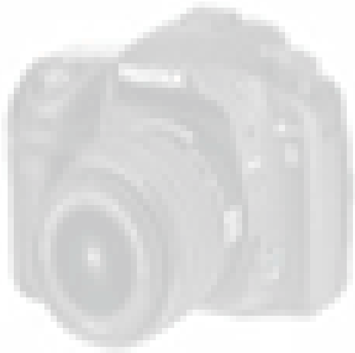
Foto non disponibile

Villa sicaminea ( https://www.viagginrete-it.it/struttura%20turistica.asp?id=20577 )