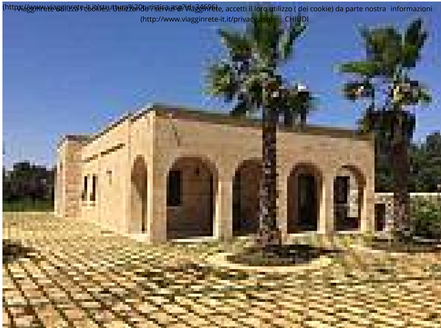
Tenuta la trebbia ( https://www.viagginrete-it.it/struttura%20turistica.asp?id=34696 )