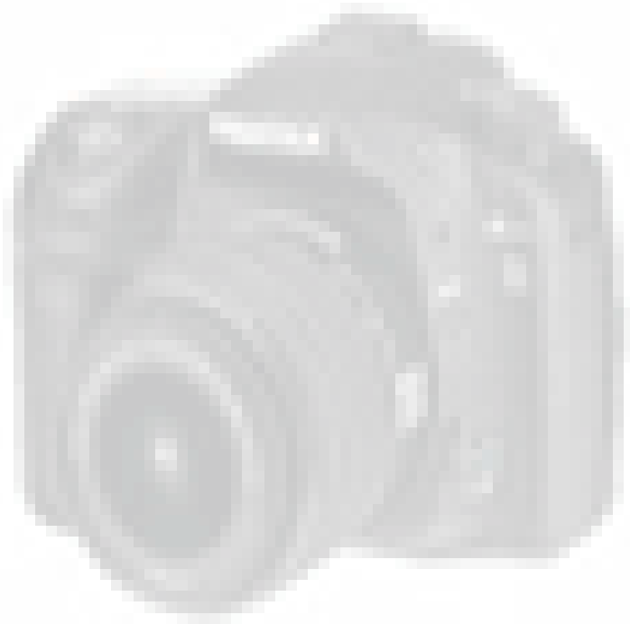
Foto non disponibile

B&b casina montana ( https://www.viagginrete.it/struttura%20turistica.asp?id=21768 )