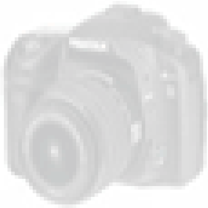
Foto non disponibile

Salentoterradivacanza ( https://www.viagginrete.it/struttura%20turistica.asp?id=14696 )